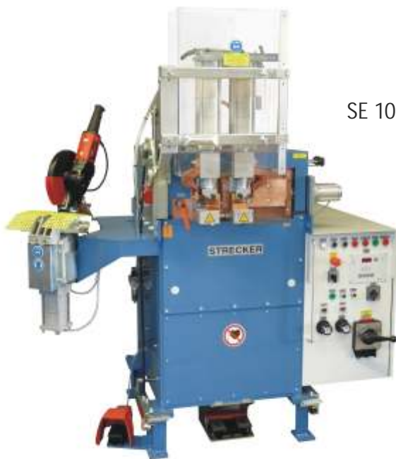
SE 100 G

Gratfreie Schweissungen an Litzen- und Leiterseilen, mit Hilfe von Glas-, Keramik- oder Graphitröhrrchen